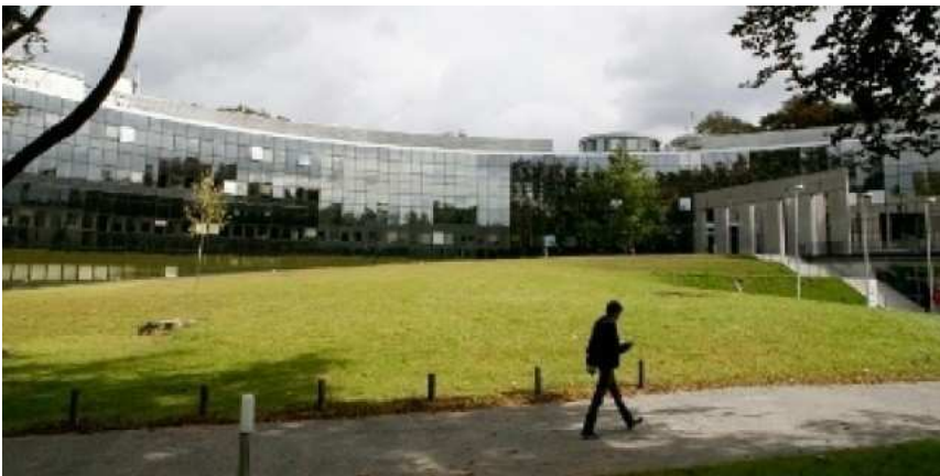
Le campus de l'Edhec Lille

Recommander 3 k Tweeter 156 23 40 Envoyer RÉAGIR